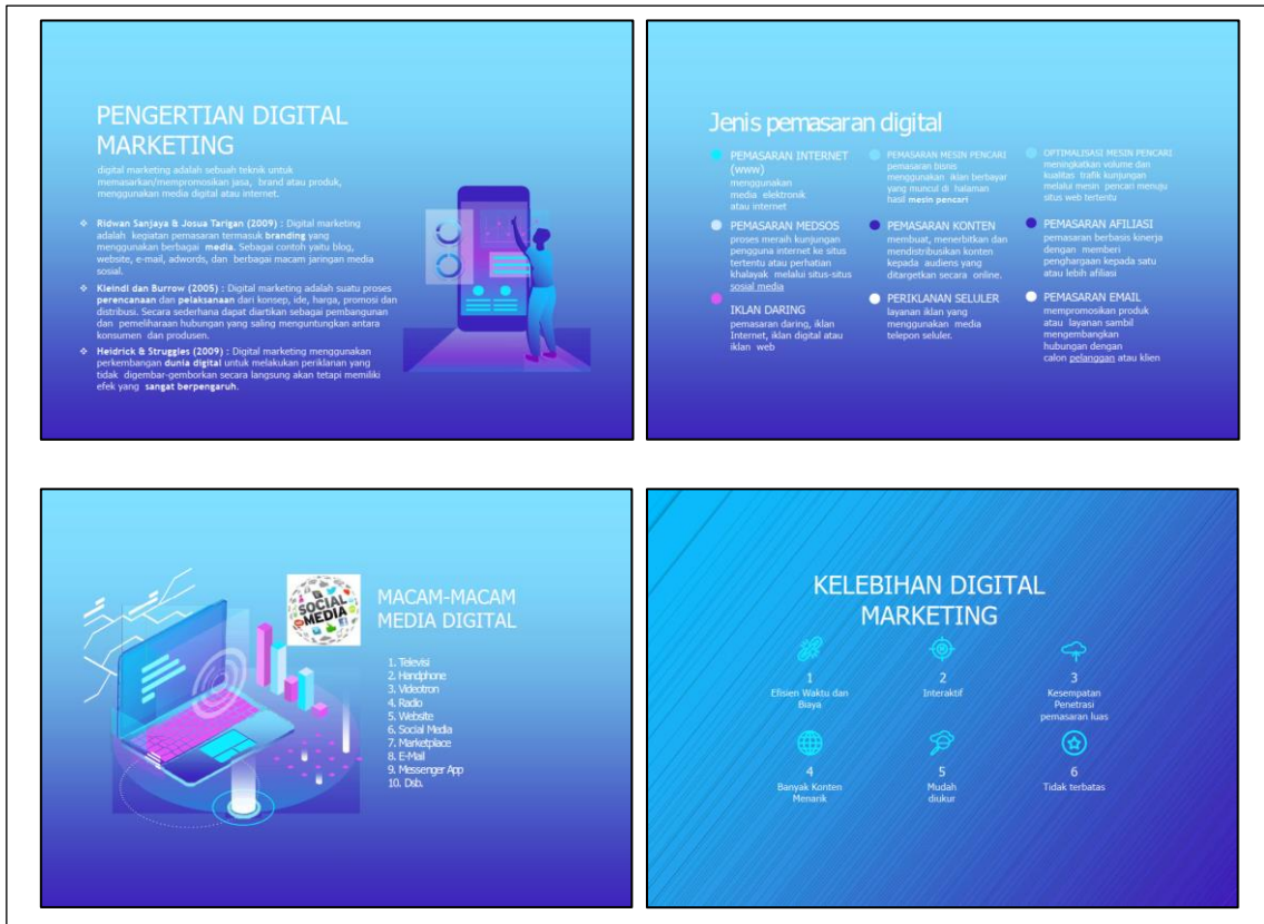
Gambar 1. Cuplikan materi topik

Selanjutnya narasumber kedua memberikan contoh-contoh platform digital yang digunakan sebagai sarana digital marketing beserta kelebihan. Cuplikan materi kedua ditunjukkan pada gambar 2.