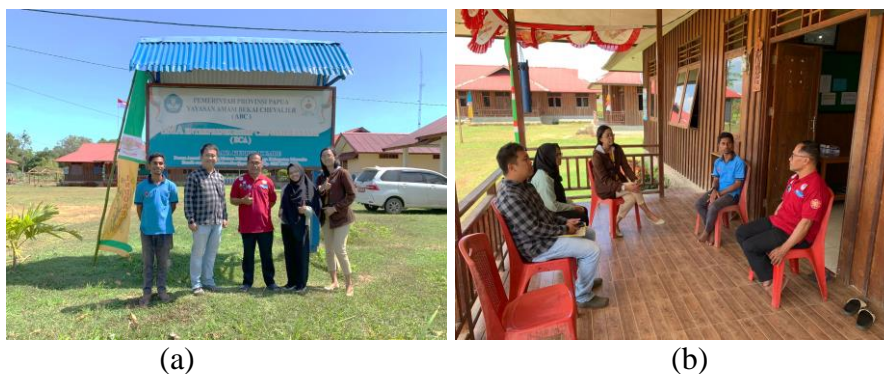
Gambar 1. (a) kegiatan survei (b) kegiatan koordinasi

Kegiatan pengabdian dan masyarakat ini diawali dengan pelaksanaan survei dan koordinasi dengan Kepala SMA ECA. Dalam kesempatan ini tim dan Kepala Sekolah mendiskusikan kondisi awal siswa dan merencanakan waktu yang tepat untuk melaksanakan kegiatan pengabdian. Tahap survei dan koordinasi ditunjukkan pada Gambar 1.