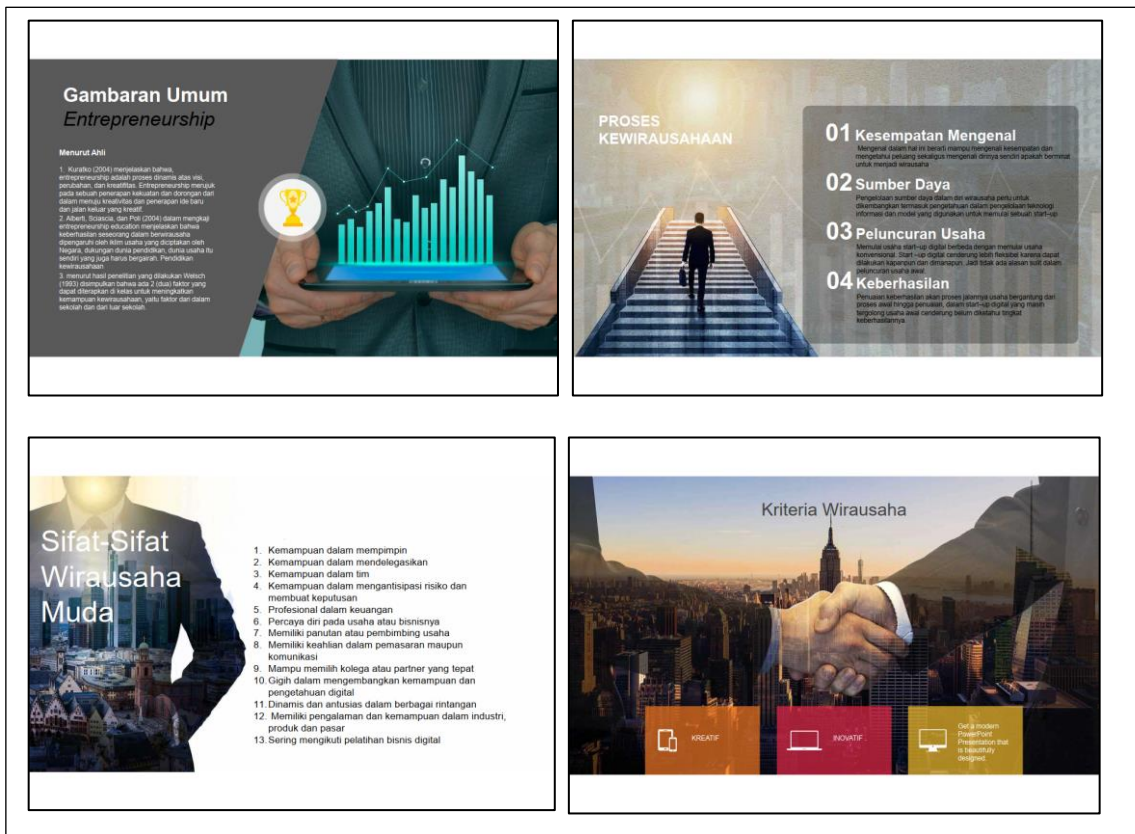
Gambar 1. Cuplikan materi topik 1

Sebagai sekolah yang menitikberatkan pada kegiatan entrepreneur, maka dalam kegiatan ini narasumber menguatkan minat dan motivasi peserta kegiatan agar dapat menjadi wirausaha muda yang kreatif dan inovatif. Penyampaian materi dan bertukar pengalaman ini dikemas dalam bentuk materi powerpoint yang cuplikannya ditunjukkan pada Gambar 1.