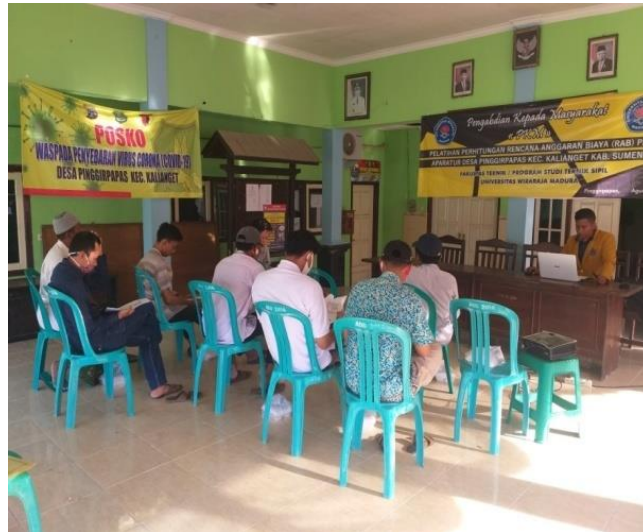
Gambar 2. Dokumentasi Kegiatan PKM

Tahap kedua, kegiatan pengabdian dilaksanakan langsung di Desa Pinggirpapas bersama seluruh tim dan aparatur Desa Pinggirpapas. Tim pelaksana ikut mengawasi jalannya acara, akan tetapi pelaksanaan kegiatan sepenuhnya dilakukan oleh anggota tim karena sebelumnya telah dilakukan transfer knowledge.