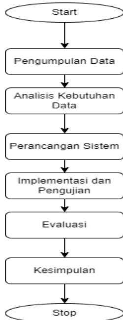
Gambar 1 Rancangan Penelitian

Beberapa rancangan penelitian yang digunakan dalam penelitian ini, antara lain pengumpulan data, analisis kebutuhan data, perancangan sistem, implementasi dan pengujian. Yang terakhir dari penelitian yang dilakukan dibuatlah evaluasi dan kesimpulan. Adapun proses penelitian yang dilakukan dapat dilihat pada Gambar 1