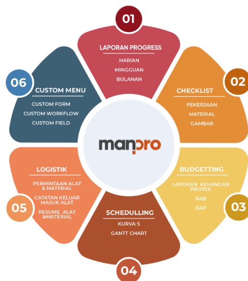
Gambar 1. Fitur Aplikasi Manpro

Pada proyek Grange Park Fatmawati – Apartement dan Fasilitasnya, PT Erakencana Tunggal selaku pemilik proyek menggunakan aplikasi Manpro sebagai platform komunikasi dalam koordinasi online dan memonitoring pekerjaan, dimana fitur dari aplikasi terlihat pada Gambar 1 berikut.