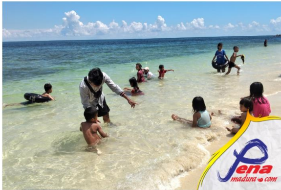
Gambar 1.1 :Suasana Pantai Pasir Putih Ketika Weekend

meminta izin kepada beberapa warga yang punya lahan tersebut (Rahman, 2023).