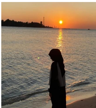
Gambar 1.3 :Pemandangan Wisata Pantai Pasir Putih Di Sore Hari