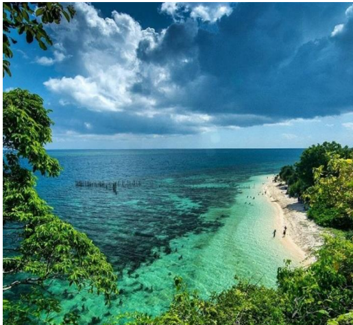
Gambar 1.2 :Pemandangan Wisata Pantai Pasir Putih Dari Atas Tebing