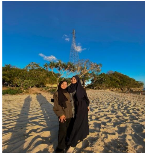
Gambar 1.4 :Pemandangan Pantai Pasir Putih

Pasir Putih yang memiliki potensi besar untuk dikembangkan dengan berbagai dampak positif yang akan diterima seperti pertumbuhan ekonomi, kesejahteraan masyarakat namun belum ada Tindakan atau kebijakan yang dilakukan terkait wisata ini, oleh pemangku kepentingan atau pemerintah untuk membangun pariwisata, sehingga peneliti dalam hal ini ingin mengkaji pembangunan pariwisata Pantai Pasir Putih melalui pendekatan Pentahelix.