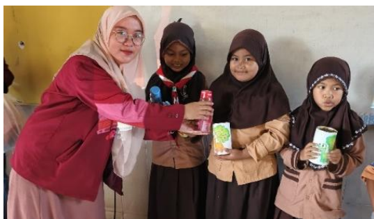
Gambar 5. Penyerahan Celengan dan Souvenir kepada Para Siswa

Hasil ini mendukung temuan Otoritas Jasa Keuangan (OJK, 2022) bahwa edukasi keuangan anak harus dimulai sejak dini melalui metode yang sederhana, kontekstual, dan menyenangkan. Dengan menabung menggunakan celengan kreatif, anak-anak lebih mudah memahami konsep menyetor uang dan membedakan antara kebutuhan dan keinginan.