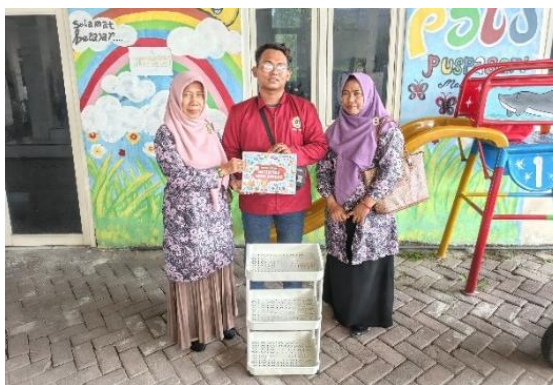
Gambar 2. Penyerahan Buku dan Rak kepada Kepala Sekolah

Pelaksanaan program Pojok Baca diawali dengan tahap persiapan, yaitu koordinasi dengan pihak sekolah, perangkat desa, dan tokoh masyarakat. Pada tahap ini ditentukan lokasi penempatan rak buku, yaitu di Balai Desa Tandegan dan di UPT SD Negeri 67 Gresik, agar akses anak-anak lebih merata. Serta dilengkapi dengan ±55 judul bacaan berupa cerita rakyat, dongeng bergambar, komik edukatif, serta buku pengetahuan dasar anak.