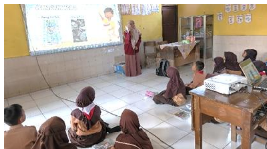
Gambar 4. Pemberian Edukasi Keuangan Kepada Para Siswa

Tahap pelaksanaan awal, berupa sosialisasi dan penyuluhan kepada 34 anak usia 6–12 tahun mengenai konsep sederhana menabung. Kegiatan dilanjutkan dengan pelatihan membuat celengan kreatif dari botol plastik bekas untuk dihias dan digunakan sebagai wadah tabungan pribadi.