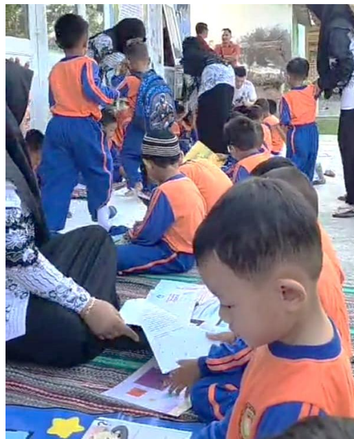
Gambar 3. Kegiatan Membaca Bersama Didampingi Ibu Guru

Tahap berikutnya adalah sosialisasi kepada orang tua dan anak-anak mengenai manfaat Pojok Baca, yang dilanjutkan dengan kegiatan peresmian dan pembukaan pertama. Pada tahap pelaksanaan, kegiatan rutin dilakukan berupa membaca bersama, sesi mendongeng oleh guru, dan diskusi singkat yang difasilitasi relawan pengabdian.