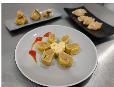
Gambar 1. Uji Coba Resep di Laboratorium Prodi Bisnis Jasa Makanan UAD