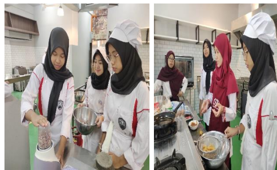
Gambar 3. Pelaksanaan pelatihan di SMK Sekolah Indonesia Kota Kinabalu

mengamati cara penggunaan alat pengemas vakum. Kemudian perwakilan siswa mencoba praktik menggunakan pengemas vakum. Belum ada siswa yang pernah menggunakan alat pengemas vakum sebelumnya. Sehingga hal ini menjadi pengalaman belajar yang menyenangkan.