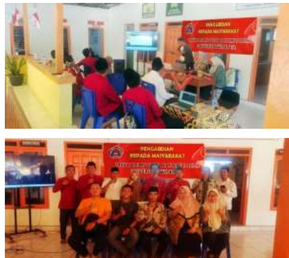
Gambar 4. Pendampingan arsip berbasis digital dengan Narasumber

Di bawah ini adalah foto dokumentasi dalam kegiatan pengabdian kepada masyarakat yang dilakukan di Balai Desa Ellak Daya, seperti terlihat pada Gambar dibawah ini.