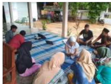
Gambar 2. Kegiatan pelatihan dan pendampingan penggunaan Aplikasi Lapor TBC bersama kader kesehatan TBC desa Grujugan